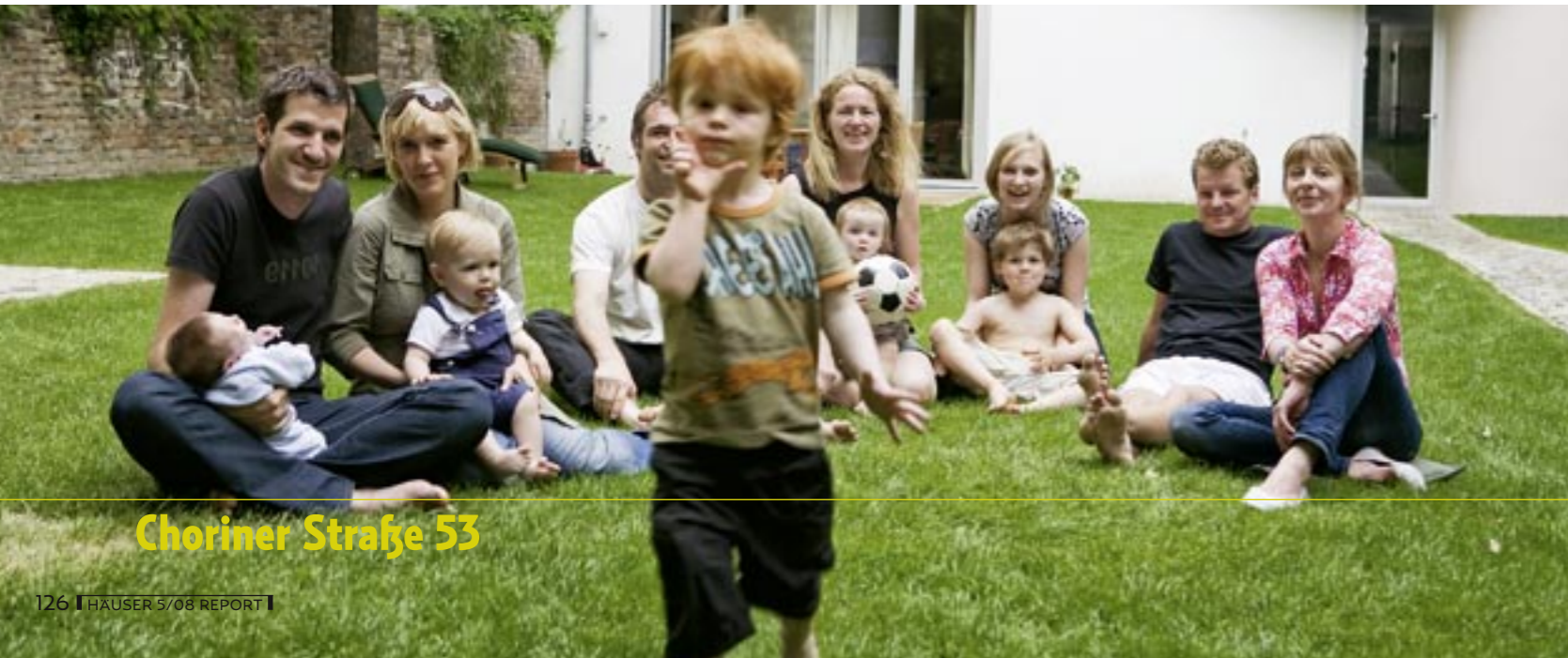
Choriner Straße 53

Schon die etagenweise variierenden Fassaden zur Choriner Straße und zum großzügig angelegten Gemeinschaftsgarten lassen ahnen, dass hier kein gewöhnlicher Geschosswohnungsbau entstanden ist. Zoomarchitekten planten flexible Grundrisse, die den Bauherren auch spätere Änderungen erlauben. Von der Dreizimmerwohnung bis zur dreigeschossigen Maisonette mit sechs Meter hohem Wohnbereich reicht die Bandbreite der insgesamt sieben Einheiten.